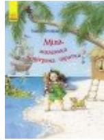
Міла, маленька повітряна піратка