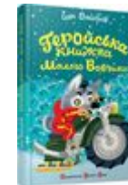
Пригоди Малого Вовчика. Геройська книжка Малого Вовчика