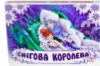
Панорамка. Снігова королева