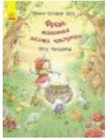
Фріда, маленька лісова чаклунка