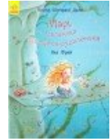
Марі, маленька принцеса-русалонька