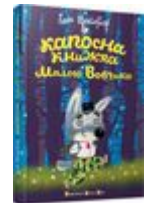
Пригоди Малого Вовчика. Капосна книжка Малого Вовчика