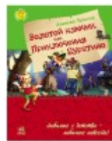
Любимая книга детства. Золотой ключик или приключения Буратино